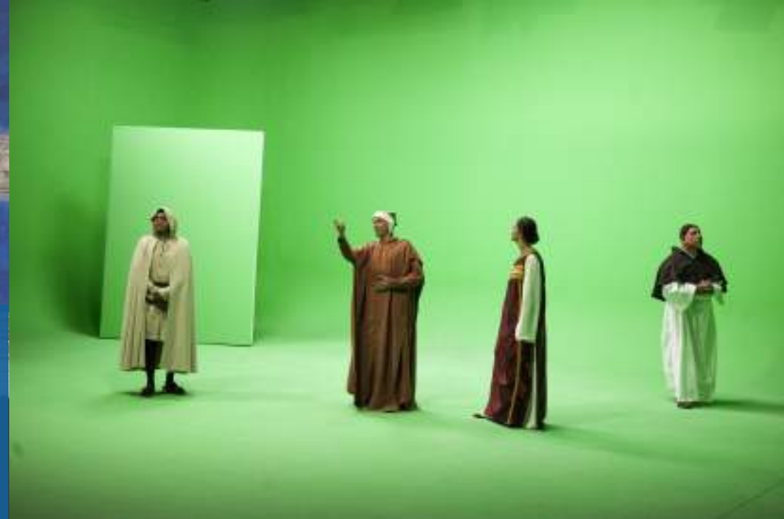
STUDIO WALD - ZEVIO (VR)